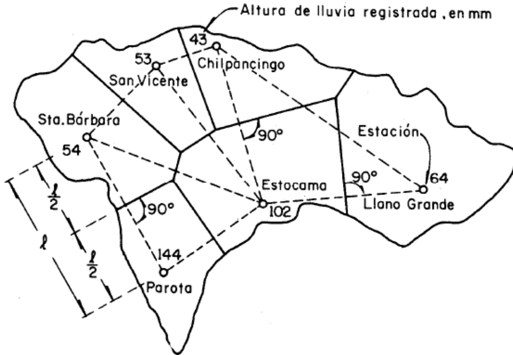
Polígonos de Thiessen de estaciones pluviométricas en la cuenca de los ríos Papagayo y Omitlán, Gro.

Obtener la altura de precipitación media en la cuenca de los ríos Papagayo y Omitlán, Gro. (figura de abajo), aplicando el método de Thiessen, para una tormenta que se presentó en un día.